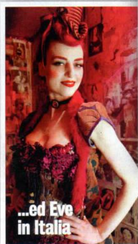
...ed Eve in Italia

re e quelli che no invece, è meglio non far vedere. Di essere quello che vogliono gli uomini. I figli. I capi-ufficio. I media. I sociologi e i politici, i medici e i ginecologi. I preti e i parrucchieri. Basta. Così, ognuna ci prova a modo suo, a liberarsi. Per una Giovanna Mezzogiorno , attrice e giurata all'ultimo Festival di Cannes, che dichiara come nessuno obblighi una collega a denudarsi, o a saltellare sul red carpet "svestita" come una coniglietta di Playboy, c'è una Carla Bruni che si presenta alle visite ufficiali senza reggiseno. E fa scandalo. Soprattutto quando la première dame de France non tace sulle prestazioni sessuali sue e del presidenziale consorte, mentre un capo di Stato li attende per un'udienza. Per una Juliette Binoche che non ha paura di mostrarsi, nel suo ultimo film Copia Conforme , senza trucco o quasi, come una moglie qualunque, c'è una Madonna che, per la campagna stampa di Dolce e Gabbana, potenzia tutto il suo sex appeal di cinquantenne palestrata, liftata e